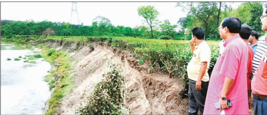
করতোয়া নদীর ভাঙনে এভাবেই নদীগর্ভে চলে যাচ্ছে চা-বাগানের একটি বড় অংশ।