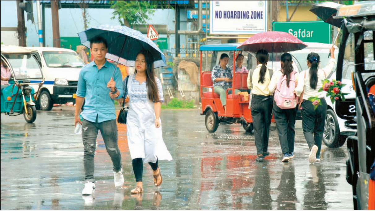
বৃষ্টিতেও সস্তি নেই। কমেই গরম। শিলিগুড়িতে, শনিবার।