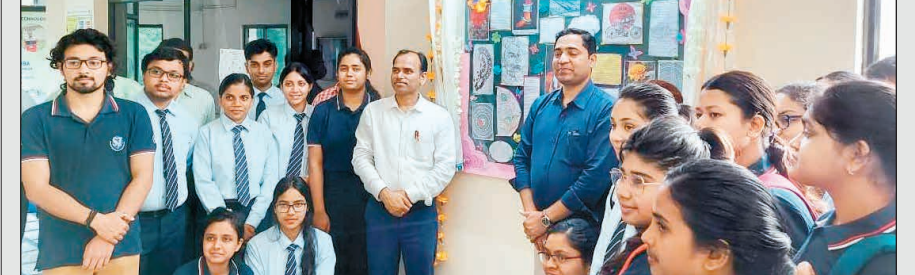
দেওয়াল পত্রিকা প্রকাশ অনুষ্ঠানে এসআইটির অধ্যক্ষ-সহ ইলেকট্রনিক্স অ্যান্ড কমিউনিকেশন ইঞ্জিনিয়ারিং বিভাগের শিক্ষক ও পড়ুয়া।